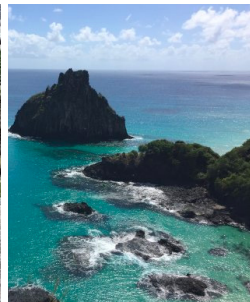
Atlântico com influência mediterrânica